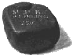
Der älteste Curlingstein aus dem Jahre 1511

Der älteste Curlingstein stammt aus dem Jahre 1511. Die erste schriftliche Erwähnung von einem Spiel auf Eis wurde im Februar 1541 verfasst. Henry Adamson verwendete das Wort Curling zum ersten Mal in einem Gedicht.